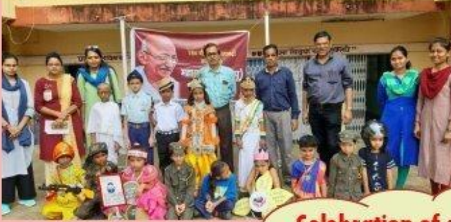
Celebration of 150 th Birth Anniversary of Mahatma Gandhi