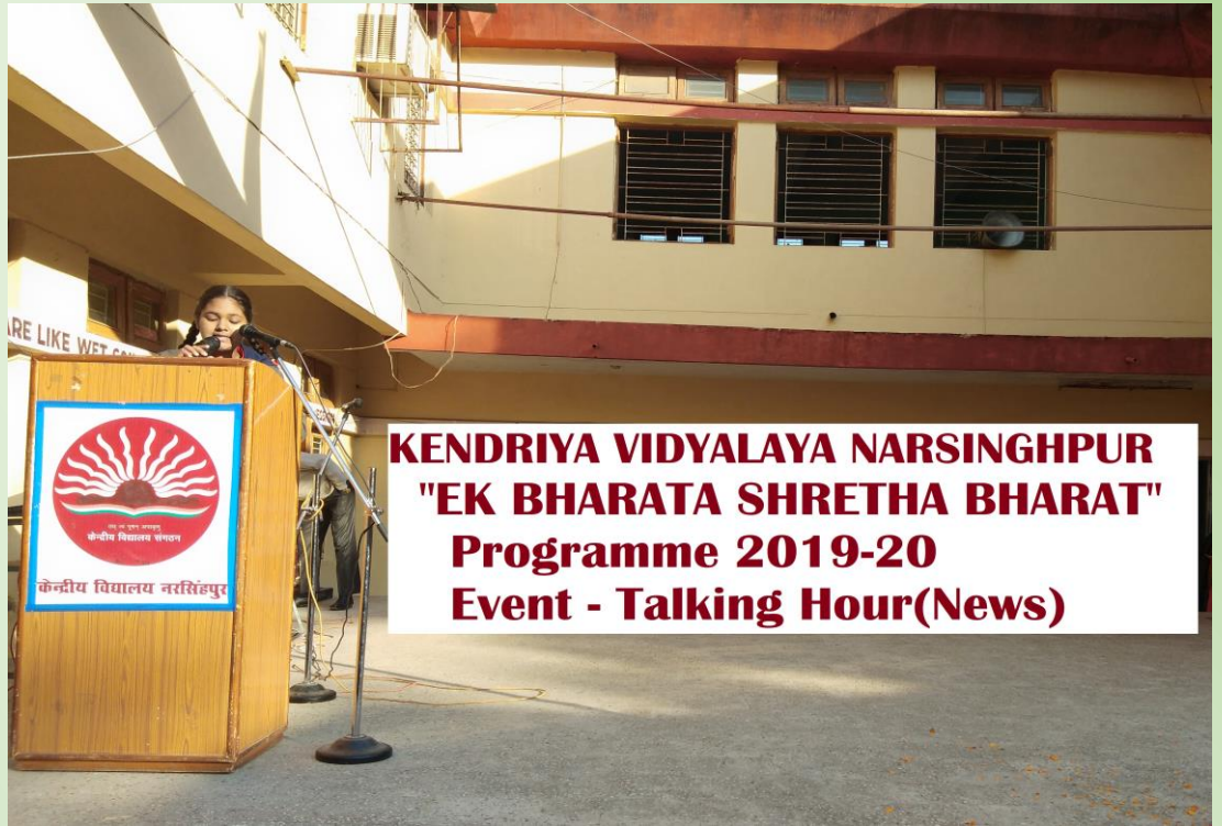
KENDRIYA VIDYALAYA NARSINGHPUR "EK BHARATA SHRETHA BHARAT" Programme 2019-20 Event - Talking Hour(News)

Under Ek Bharat Shreshtha Bharat activities news and important events of pertaining state covered in morning assembly every week on Monday. Students were benifited by the knowledge of a different state weekly and got familiar with the culture of the partnering state.